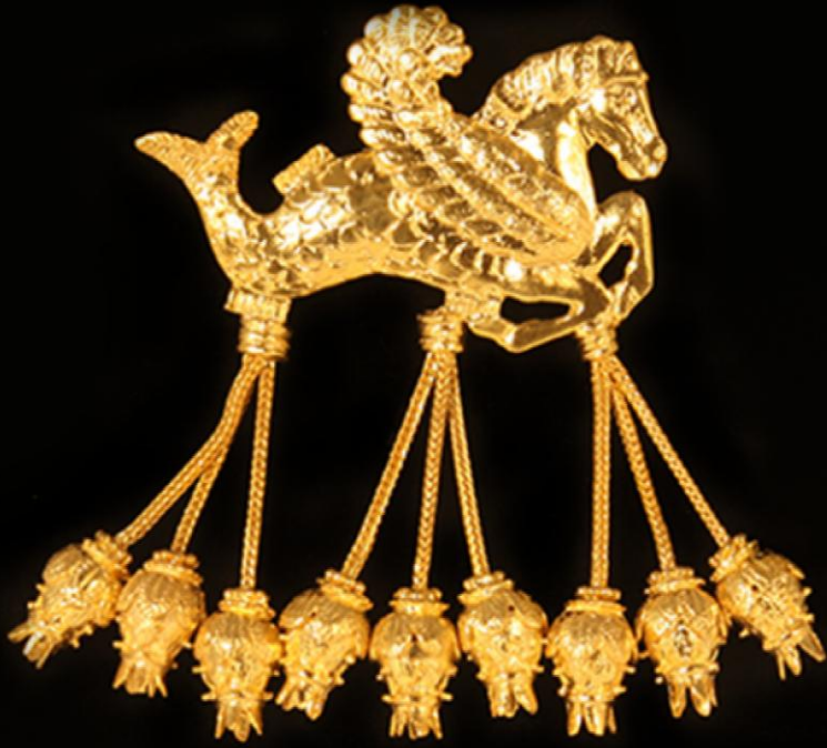
Karun Hazinesi- Kanatlı Deniz Atı Broşu