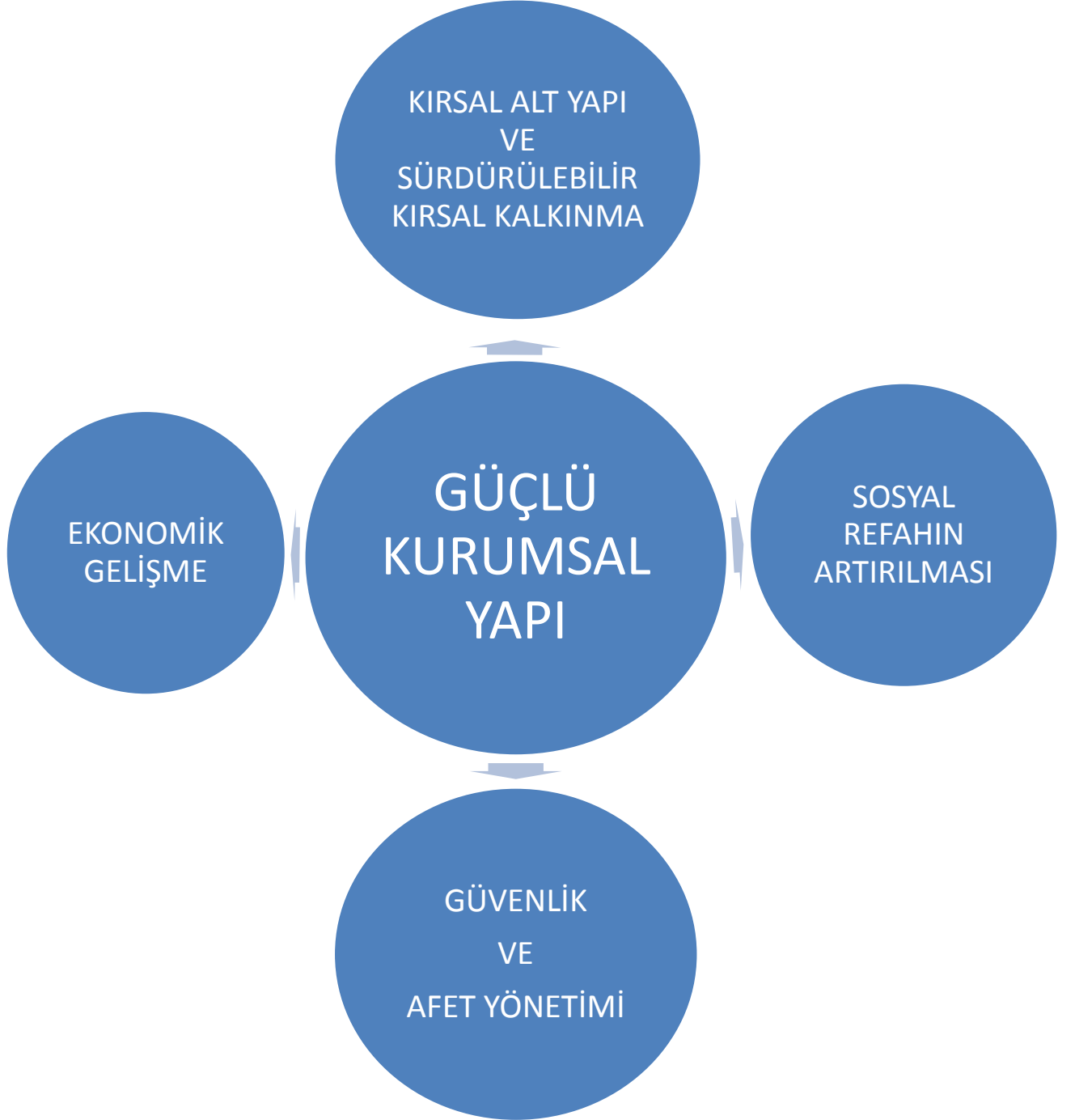
Şekil 2: Amaçlar